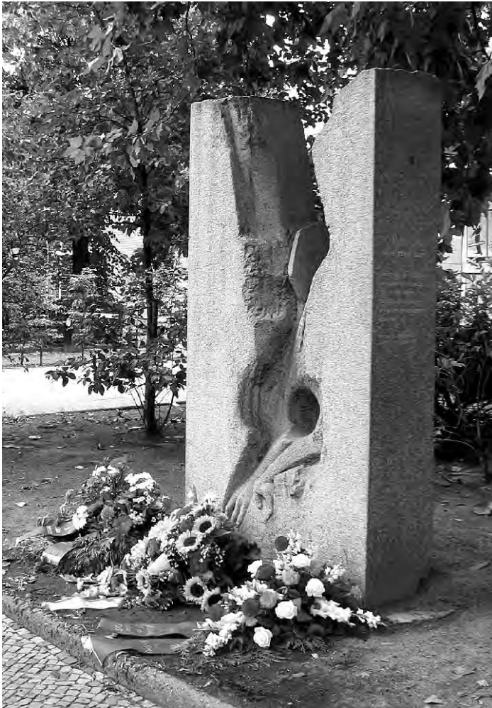
Gedenkstein für Cemal Kemal Altun (Hardenbergstraße, Berlin-Charlottenburg)